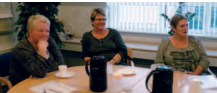
Tænk over hvad du spiser og kom i gang med motion, er budskabet til deltagerne.

I vores indlæg fra faggruppelandsmøderne i sidste nummer af bladet kom dette indlæg ikke med. Vi beklager fejlen.