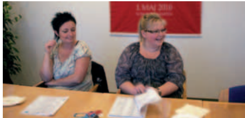
Vi ved jo godt, hvad der skal til. Nu får vi et skub, og nu skal der ryge nogle kilo, siger deltagerne.

- Vi ved jo alle godt, hvad der skal til. Her får vi et skub til at gøre noget ved det. Der er ligesom lagt et pres på